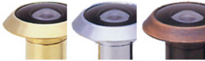
真鍮色 クロームメッキ 銅ブロンズ